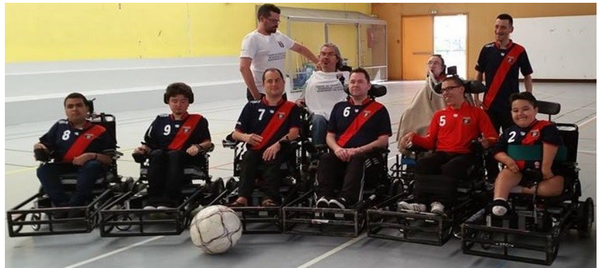
L'équipe 1 qui évolue en division 2 cette saison

L'équipe 3, avec 3 nouveaux jeunes dans son effectif va tout faire pour finir la saison première de la poule sud-est et par la même occasion se qualifier pour les phases finales prévues en Juin à Quimper.