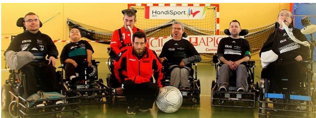
L'équipe 2 qui évolue en Division 3 cette saison

L'objectif pour notre équipe cette saison est de monter en première division donc terminer soit premier soit second du championnat de D2.